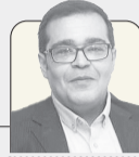
رضا رئیسی روزنامه‌نگار و تحلیلگر سیاسی